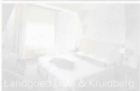
Landgoed Duin & Kruidberg