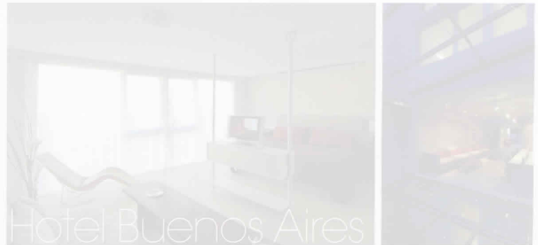
Hotel Buenos Aires

Een op dit moment razend populaire bestemming is Argentinië. Met een subtropisch noorden en een behoorlijk koud zuidelijk deel is geen land zo divers. Hoofdstad Buenos Aires is een prachtige, bruisende stad. Mocht deze place to be op je lijstje staan, boek dan Design Hotel CE. Dit strak maar sfeervol ingerichte familiehotel is vriendelijk voor de portemonnee (prijzen vanaf € 100,-) en ligt ook nog eens in het centrum. www.designce.com